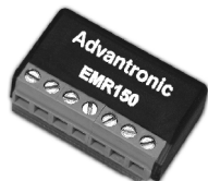
EMR150 Módulo electrónico selector de hoja