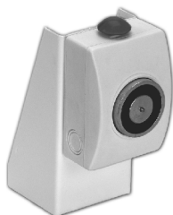
EST10 Soporte 90°